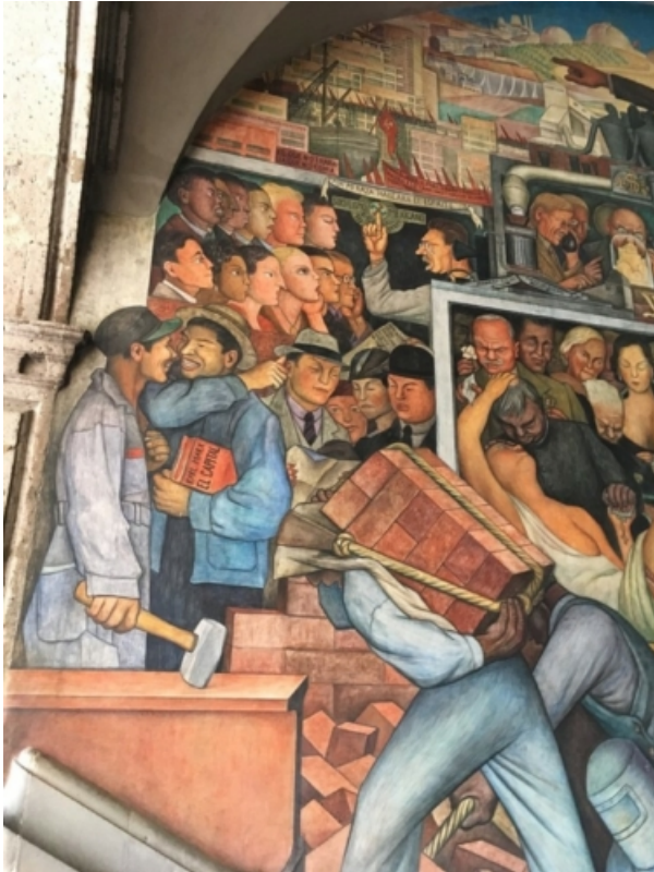
Mexikos Gesellschaftspyramide mit Trotzki als Retter – Wandgemälde von Diego Rivera