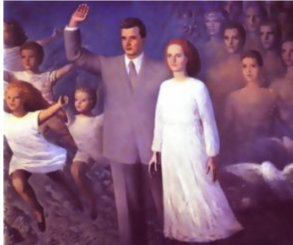
Nationalkommunistische Familienmetaphorik: Nicolae und Elena Ceaușescu als Eltern der rumänischen Nation