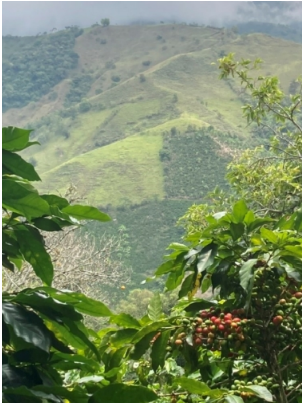
Schön, aber fest in der Regie von Paramilitärs: Teile der kolumbianischen Kaffeezone

Die Rechte im östlichen Europa hat mit alldem wenig zu tun und ist ein weitaus komplexeres, „tieferes“ Phänomen, ohne deswegen politisch mächtiger zu sein.