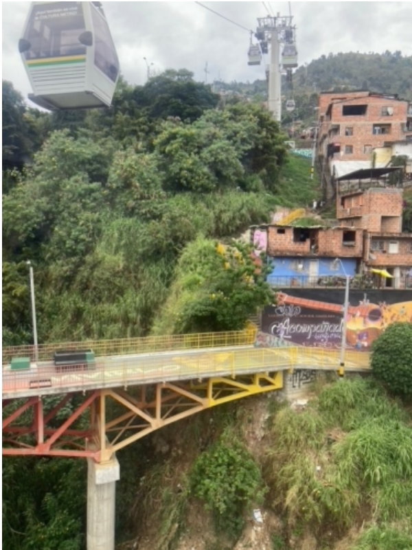
Hochmoderne Drahtseilbahn schwebt über Armutsviertel hinweg: Medellín

bewussten, gelebten und funktionierenden Multikulturalismus; aber ganz unübersehbar gibt es auch die Kombination von massiver Migration, ethnischer Separation und wechselseitigem Misstrauens zwischen verschiedenen Gruppen einer Einwanderungsgesellschaft, in der jede Gruppe sich vor allem an ihre eigenen Regeln hält und die Gültigkeit des alle verbindenden Regelwerks infrage stellt.