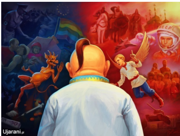
Eine religionisierte Wahl zwischen West und Ost, Böse und Gut: Die Ukraine von 2014 aus russisch-antiwestlicher Sicht, © Klaus Buchenau

Grundannahmen könnten durch systematische, auf Fallstudien eingegrenzte Forschungen überprüft werden: So etwa die Hypothese, dass Identitäten im östlichen Europa ethnisiert und „religionisiert“ sind, in Lateinamerika dagegen eher entlang sozialer Kriterien bestimmt sind – vielleicht habe ich überzogen und ein Detailvergleich käme zu nuancierten Ergebnissen? Lohnend wären auch Forschungen über das historische Gedächtnis in beiden Regionen, um die hier formulierte Hypothese des kompakten ethnisch-nationalen Geschichtsnarrativs im östlichen Europa und des sozialen „Zerrissenheitsnarrativs“ in Lateinamerika zu überprüfen. Möglich wäre auch ein vergleichender Blick darauf, wie Identitäten und Gedächtnisse in konkrete Politiken übersetzt werden, etwa im Bereich der regionalen Integration. Wenn es stimmt, dass sich die osteuropäischen Ethnonationen nicht nur als postimperial, sondern gleichzeitig auch gegeneinander definierten, wogegen die lateinamerikanischen Nationalstaaten viel stärker auf (pseudo)imperiale Gegenüber fixiert sind, dann müsste sich daraus ergeben, dass regionale Integration in Lateinamerika von innen heraus „gegen den äußeren Feind“ stattfinden kann. Dagegen muss im östlichen Europa vor allem von außen angeleitet werden, weil das wechselseitige Misstrauen in der Region anderes oft verhindert. Wer das südamerikanische Integrationsprojekt Mercosur mit der EU-Erweiterung vergleicht, scheint dieses Grundmuster auch in der Realität wiederzufinden.