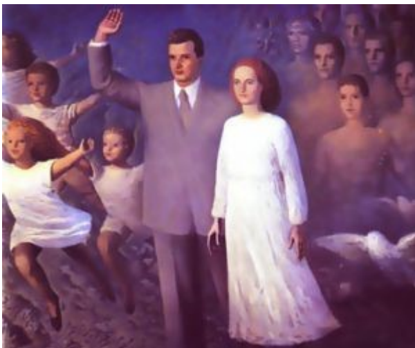
Nationalkommunistische Familienmetaphorik: Nicolae und Elena Ceaușescu als Eltern der rumänischen Nation

In historischer Perspektive scheint es, dass der Faktor „Erfahrung mit dem Realsozialismus“ als Erklärung zu kurz greift. In Lateinamerika lässt sich der antiimperialistische wie auch der antikapitalistische Diskurs, als Gegenentwurf zur real bestehenden, oligarchischen Ordnung, bis tief ins 19. Jahrhundert zurückverfolgen. Dieser soziale Diskurs hat im östlichen Europa keine direkte Entsprechung, hier dominiert schon im 19. Jahrhundert die Tendenz, gesellschaftliche Konflikte ethnisch-national zu begreifen; dieser Unterschied hängt ganz offensichtlich zusammen mit den oben erwähnten Unterschieden zwischen den Kolonialreichen und dem Erbe, das sie hinterließen.