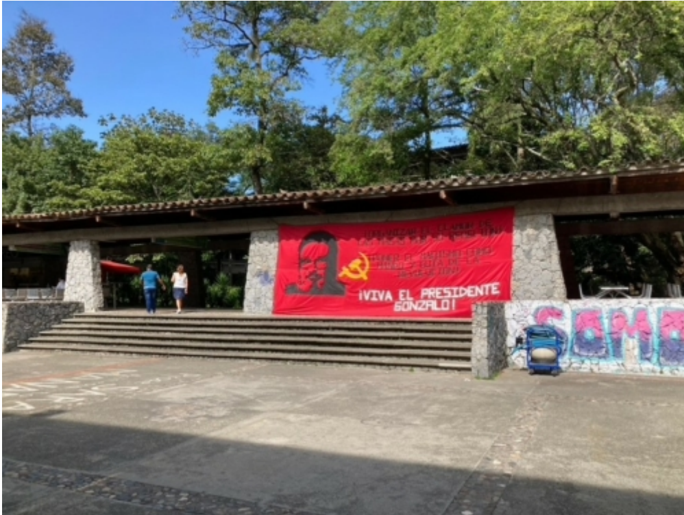
Die Universität Medellín in Kriegsbemalung: Der Maoismus des „Leuchtenden Pfades“ soll es richten

Ich habe hier nur einige Aspekte herausgegriffen, die sich aus einer wechselseitigen Spiegelung des östlichen Europa und Lateinamerikas ergeben. Als Forschungsfeld hat der Vergleich der Regionen, aber auch die Verflechtung der Regionen, noch weitaus größeres Potential. Manche der hier skizzierten Grundannahmen könnten durch systematische, auf Fallstudien eingegrenzte Forschungen überprüft werden: So etwa die Hypothese, dass Identitäten im östlichen Europa ethnisiert und „religionisiert“ sind, in Lateinamerika dagegen eher entlang sozialer Kriterien bestimmt sind – vielleicht habe ich überzogen und ein Detailvergleich käme zu nuancierten Ergebnissen? Lohnend wären auch Forschungen über das historische Gedächtnis in beiden Regionen, um die hier formulierte Hypothese des kompakten ethnisch-nationalen Geschichtsnarrativs im östlichen Europa und des sozialen „Zerrissenheitsnarrativs“ in Lateinamerika zu überprüfen. Möglich wäre auch ein vergleichender Blick darauf, wie Identitäten und Gedächtnisse in konkrete Politiken übersetzt werden, etwa im Bereich der regionalen Integration. Wenn es stimmt, dass sich die osteuropäischen Ethnonationen nicht nur als postimperial, sondern gleichzeitig auch gegeneinander definierten, wogegen die lateinamerikanischen Nationalstaaten viel stärker auf (pseudo)imperiale Gegenüber fixiert sind, dann müsste sich daraus ergeben, dass regionale Integration in Lateinamerika von innen heraus „gegen den äußeren feind“