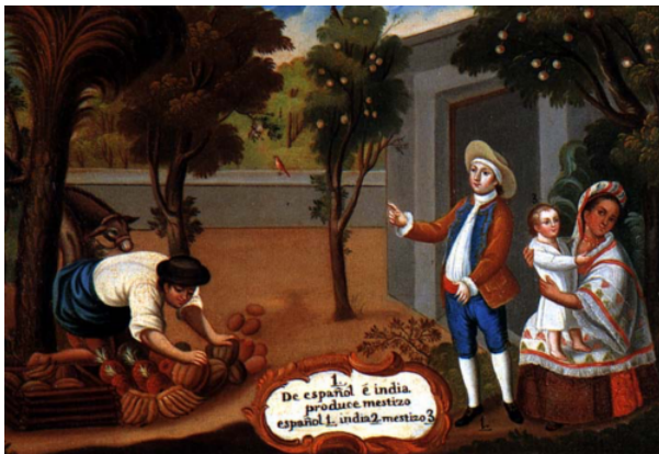
„Spanier und India ergeben Mestizo“, unbekannter Autor, Ende 18./Anfang 19. Jahrhundert, © Wikipedia public domain

Verbindung zwischen männlichen Europäern und weiblichen Indigenen und seltener Schwarzen entstammte. In vielen Ländern Lateinamerikas bilden die meist mestizos (Mischlinge) genannten Menschen heute die Mehrheit. Der mexikanische Intellektuelle José Vasconcelos prophezeite 1925, den Mestizen werde als „kosmische Rasse“ eine globale Führungsrolle zukommen. In der Realität der lateinamerikanischen Staaten ist davon nicht viel zu spüren, in der Regel wird ein höherer sozialer Status mit hellerer Haut assoziiert, und der Aufstieg durch Heirat in „weiße“ Kreise wird blanquearse (weiß werden) genannt.