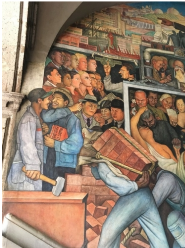
Mexikos Gesellschaftspyramide mit Trotzki als Retter – Wandgemälde von Diego Rivera

und auch in der Konfrontation mit den Vereinigten Staaten. Während die Rechten diese Konfrontation als Katastrophe für die Wirtschaft und für das eigene Geschäft ansehen, sieht das die radikale Linke, und Teile der Gesellschaft mit ihr, nicht als Problem an, weil die USA diskursiv mittlerweile in die Rolle des kolonialen Spanien gerückt sind, also als das neue ausbeuterische Imperium gelten.