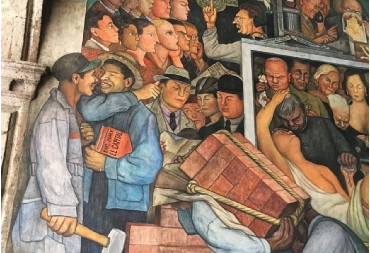
Mexikos Gesellschaftspyramide mit Trotzki als Retter – Wandgemälde von Diego Rivera