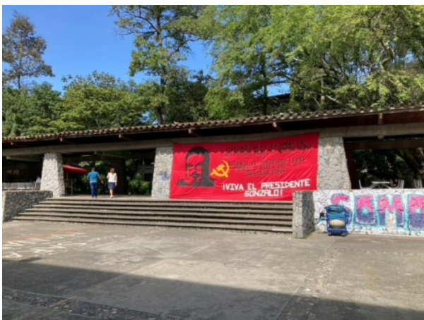
Die Universität Medellín in Kriegsbemalung: Der Maoismus des „Leuchtenden Pfades“ soll es richten

Im Vergleich dazu wirkt die lateinamerikanische Linke überaus frisch, weil sie, anders als die Rechte, die direkte Bearbeitung der schwersten postimperialen Hinterlassenschaft verspricht: der steilen Gesellschaftspyramide. Wie vital dieses Denken ist, sieht man vor allem daran, dass auch historische Rückschläge nicht dazu führen, linkes Denken nachhaltig zu diskreditieren. Verziehen wird eigentlich alles: dass das kubanische Modell seine Schattenseiten und ohnehin seine besten Zeiten hinter sich hat; dass Nicaragua sich nach der Rückkehr der Sandinisten an die Macht in eine reaktionäre Autokratie verwandelt hat; dass aus dem venezolanischen „Modell“ Armut und Massenflucht geworden sind; dass die autoritäre Wende der linken Präsidenten Evo Morales in Bolivien oder Rafael Correa in Ecuador nur durch deren Sturz beendet werden konnte – das alles kann dem Wahlerfolg linker Politiker offenbar nur wenig anhaben, wie etwa die Wahlsiege von Andrés Manuel López Obrador in Mexiko, Lula da Silva in Brasilien, Gustavo Petro in Kolumbien oder Gabriel Boric in Chile seit 2022 zeigen.